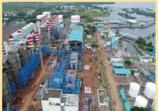
ADD ON PLTGU 650 MW MUARA TAWAR PROJECT WEST JAVA8