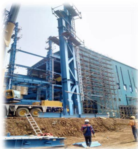
ADD ON PLTGU 650 MW MUARA TAWAR PROJECT WEST JAVA

The Company's employees also receive various facilities and support for employee welfare in the form of remuneration standards, BPJS Health and BPJS Employment membership. Even more than that, employees' families also receive important attention from the Company because one of the goals of employees working is to provide welfare for their families. The Company is actively involved in community development activities, either directly or indirectly. The Company directly provides assistance to the surrounding community in every religious social activity and other activities. The Company indirectly contributes through the development of the quality of education. The Company has become one of the venues for implementing dual system education for vocational high school students. With the opportunity to learn directly in the world of work, students will be better prepared to face the challenges of the world of work with better quality.