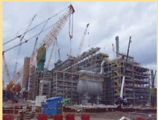
REFINERY DEVELOPMENT MASTER PLAN (RDMP) PERTAMINA PROJECT BALIKPAPAN EAST KALIMANTAN