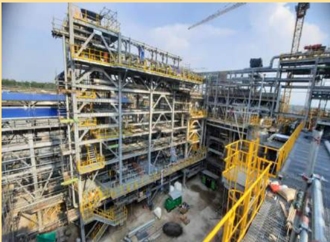
GAS DEVELOPMENT JAMBARAN TIUNG BIRU PERTAMINA PROJECT BOJONEGORO EAST JAVA

It aims to drive better changes in the supply chain The Company, which does not only focus on achieving overall financial performance optimally, but also actively participates in the welfare of the community, supports infrastructure development carried out by the government and the environment in a sustainable manner.