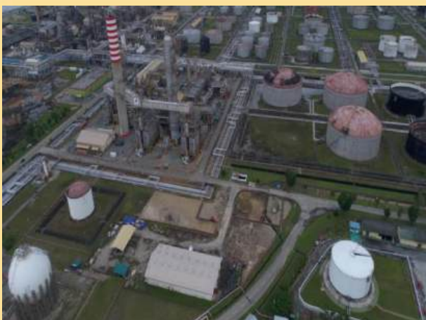
REFINERY DEVELOPMENT MASTER PLAN (RDMP) PERTAMINA PROJECT BALIKPAPAN EAST KALIMANTAN